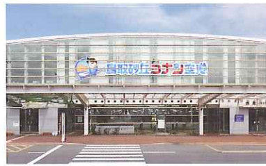
国際会館 特大サイン