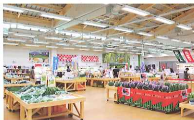
地場産プラザ わったいな