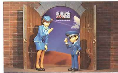
国内線ターミナル到着ロビー ウェルカムスペース