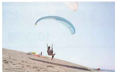
パラグライダー (鳥取砂丘)