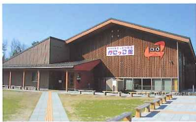
とっとり賀露 かにっこ館