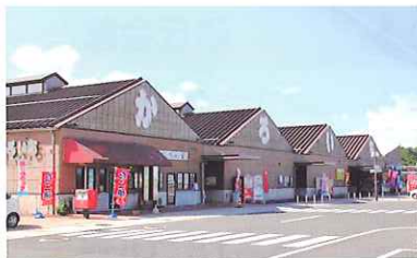
海鮮市場 かるいち