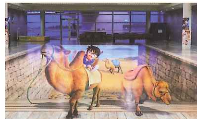
国際会館1F 特大トリックアート