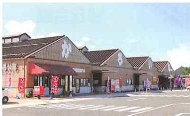
海鮮市場 かるいち