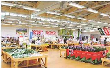
地場産プラザ わったいな