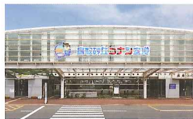
国際会館 特大サイン