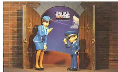
国内線ターミナル到着ロビー ウェルカムスペース