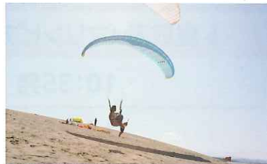
パラグライダー (鳥取砂丘)