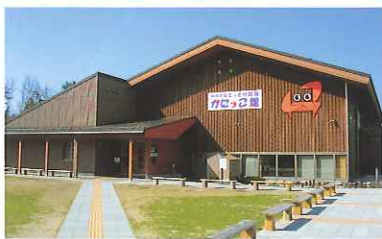
とっとり賀露 かにっこ館